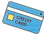
クレジットカード